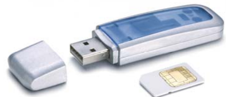
KOBIL mIdentity mit integrierter Smart Card

Sie bestimmen, was Empfänger mit den PDF-Dokumenten tun dürfen: